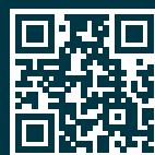
Gestaltung: M. Schmidt, mekorum