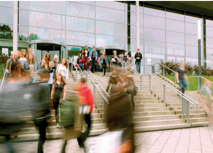
Stand: 03.2023